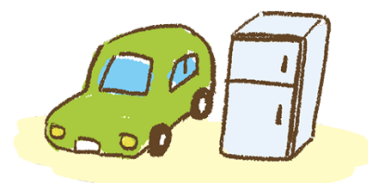
Carros, electrodomesticos, etc.

Confirme el lugar y la hora en que coleccionarán la basura a la municipalidad o a los vecinos.