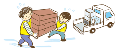
Los voluntarios le ayudarán

Consulte con el Centro de Voluntarios de Desastres (Saigai Volunteer Center), el consejo de bienestar social (Shakai Fukushi Kyogikai) o la municipalidad. Las ayudas son gratuitas.