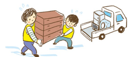
Bantuan dari relawan bencana

Ada banyak relawan yang terdaftar di "Pusat Relawan Bencana". Daripada membersihkan sendiri bersama keluarga, mari meminta bantuan dari para relawan. Silakan konsultasikan dengan Pusat Relawan Bencana, Dewan Kesejahteraan Sosial, atau kantor balai kota setempat. Bantuan ini diberikan secara gratis.