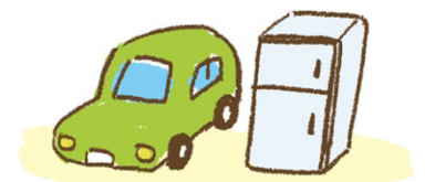
Mobil dan alat elektronik lainnya

Karena ada banyak sampah seperti mobil atau peralatan elektronik seperti kulkas, sampah tidak dikumpulkan di tempat biasanya. Pastikan untuk memeriksa jam dan tempat pembuangan sampah dengan kantor balai kota setempat atau tetangga terdekat.